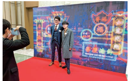
会場にはネオン輝く香港の街角を模した写真撮影コーナーも