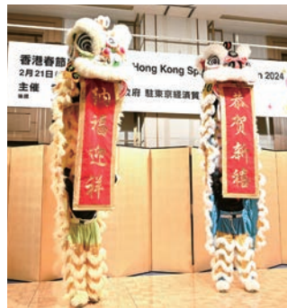
会場を沸かせたライオンダンス