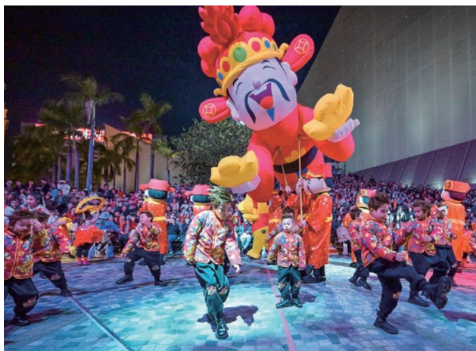
香港ではメガイベントが続々とラインナップ。写真は2月10日、旧正月の元日に行われた「キャセイル旧正月インターナショナル・ナイト・パレード」

一方、政府は省庁間の調整グループを設け、イベント主催者が省庁横断的なサポートを十分に受けられるようにすると同時に、香港においてメガイベントを支援、促進する文化を醸成することを目指します。