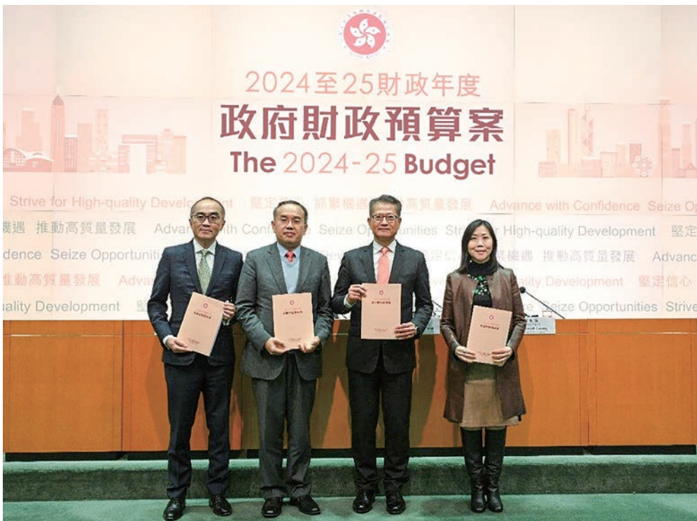
記者会見での陳茂波（ポール・チャン）財政長官（写真・中央右）。許正宇（クリストファー・ホイ）金融財務長官（中央左）、朱曼鈴（キャシー・チュー）金融財務（財務）事務次官（右端）、梁永勝（アドルフ・リヨン）政府経済顧問（左端）も出席