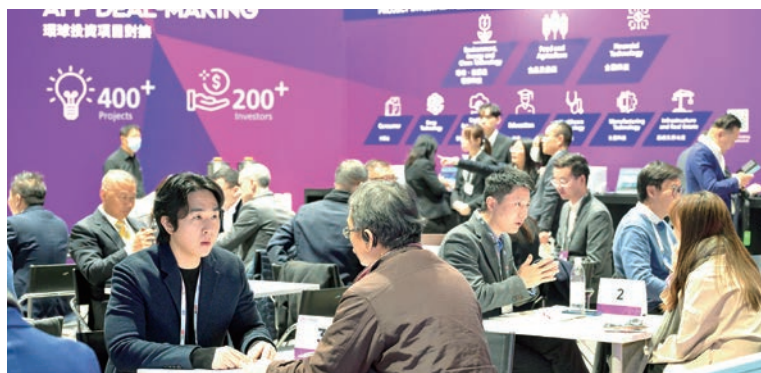
フィンテック分野のスタートアップ企業を紹介するイベントやビジネスマッチングも開催され、参加者がつながり、コラボレーションの機会を探る場を提供