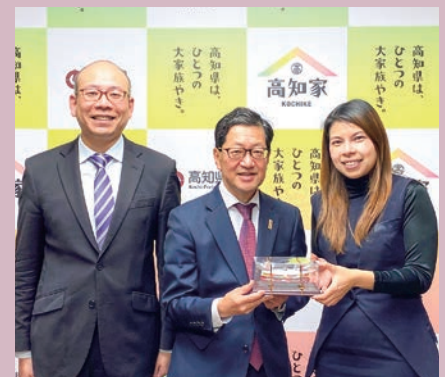
濱田省司 高知県知事（写真・中央）を訪問。香港貿易発展局の游紹斌（ベンジャミン・ヤウ）日本首席代表（左）も同席