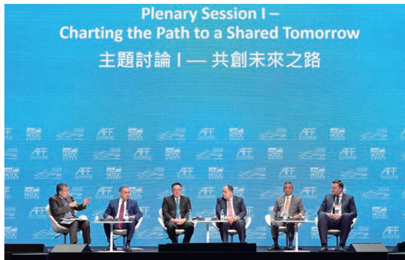
1月24日、最初の全体会議「共有の未来に向けた道筋を描く」で議長を務める許正宇（クリストファー・ホイ）金融財務長官（写真・左端）

「共通の未来に向けた多国間協力」をテーマとした今年のフォーラムには、40以上の国と地域から3,000人を超える金融当局者、中央銀行や規制当局の代表者、国際金融機関や多国間組織の幹部、金融・ビジネス界のリーダーに一流のエコノミストが集結。中国本土のビジネスチャンス、投資の見通し、グリーンファイナンス、フィンテック、ファミリーオフィスのエコシステム、人民元の国際化、大湾区開発など、注目のトピックに焦点を当て、香港の国際金融センターとしての多様な強みを反映する内容となりました。