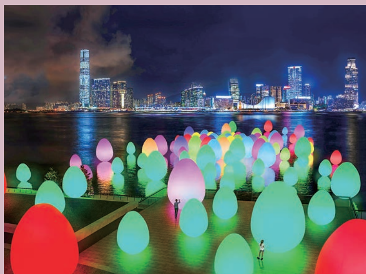
香港のスカイラインに映える『チームラボ：コンティニューアス』

https://www.museums.gov.hk/en/web/portal/artatharbour.html