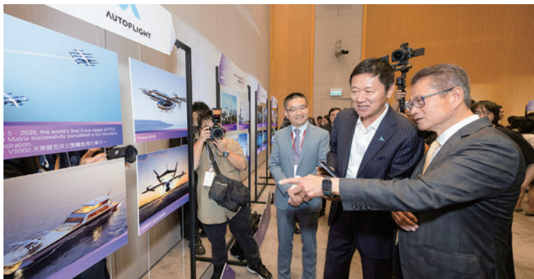
戦略的企業の幹部と懇談する陳茂波(ポール・チャン)財政長官(右)

新たに22社の「戦略的企業」が香港のパートナーに加わりました。世界ランキング10位や20位に入る製薬企業のほか、ライフ・ヘルステクノロジー、先端マイクロプロセッサ製造、汎用人工知能(AI)、スマートモビリティなどの分野の企業が含まれます。