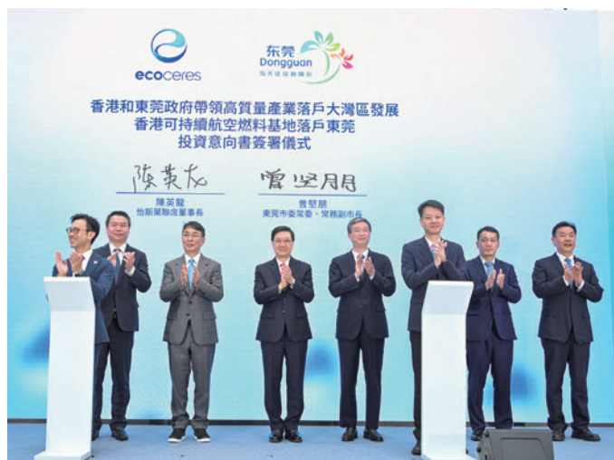
香港の企業や政府、東莞市政府の関係者らが5月上旬、覚書の調印式に臨んだ

香港で設立されたエコセレスは、廃食用油を国際認証を受けたSAFに変換する独自技術を開発し、グローバルに主導的な地位を確立しています。