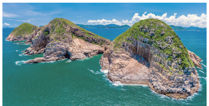
香港東部の果洲群島（ナインピン・グループ）にみられる白亜紀前期の流紋岩の柱状節理

香港ジオパークは2009年に中国の国家ジオパークとなり、2011年に世界ジオパークのネットワークに加盟しました。2015年にユネスコが世界ジオパークを正式事業化した後、「香港ユネスコ世界ジオパーク」と改称されました。