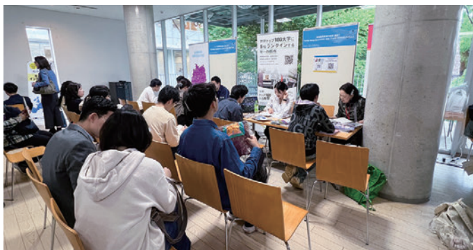
香港経済貿易代表部のブース

香港経済貿易代表部は5月23日、東京大学がグローバル人材の育成を目指して毎年開催している学内の留学フェア「Go Global」に初めて参加し、香港の大学による質の高い高等教育や世界から優秀な人材を呼び込む政府の政策を紹介しました。