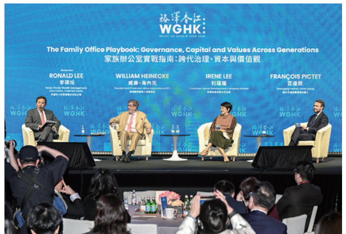
世界の富裕層の資産を管理する「ファミリーオフィス」の誘致、投資で経済効果を上げる香港。2026年「Wealth for Good in HK」サミット(3月下旬開催)では、世代を超えて富をいかに受け継げるかなど活発な議論が展開された

世界貿易機関(WTO)の報告書によると、香港は2025年、物品貿易において世界第5位の規模を記録し、前の年から順位を2つ上げて、中国、米国、ドイツ、オランダに次ぐ位置につきました。この成果は、過去1年間にわたる地政学的課題や貿易保護主義の高まりの中でも、香港が示した強靭さを裏付けるものです。