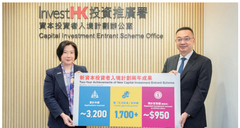
郭俊峯(ベンソン・クウォック)入境管理局長(右)と、劉凱旋(アルファ・ラウ)香港投資推進局長が同計画の2年の成果を発表

2月28日現在、香港投資推進局(インベスト香港)には約3,200件の申請が寄せられており、投資額は推計約950億香港ドル。大きな反響が、国際的な資産運用センターとしての香港の地位をさらに強くしています。