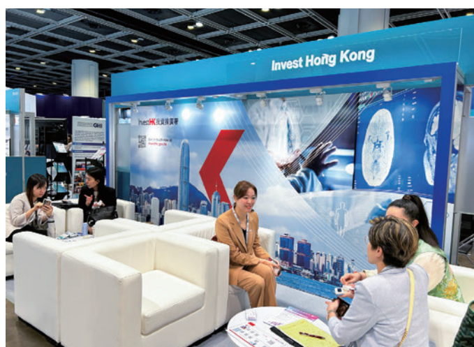
インベスト香港のASGH会場ブース

参加者の一人は、製薬分野の専門家と交流し、同セクターの強みを改めて認識できたほか、香港取引所の独自の利点への理解が深まったと語りました。