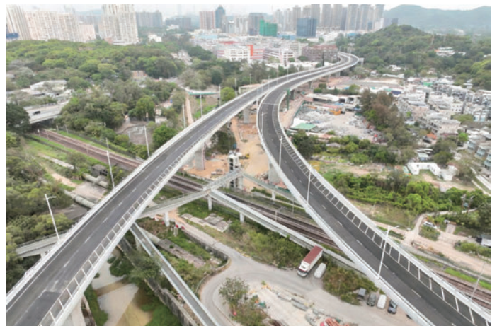
北部都会区初の大規模交通インフラプロジェクト「粉嶺バイパス」が5月上旬に開通。全長約4キロメートルの同バイパスは、粉嶺北部と粉嶺高速道路間の移動をより迅速にするルートに

国際通貨基金(IMF)の香港調査団は5月中旬に発表した報告書で、堅調なハイテク関連輸出や民間需要の改善、金融市場の活況に支えられ、香港経済が回復を続けていると指摘しました。