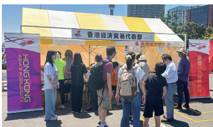
香港経済貿易代表部のブース

香港経済貿易代表部は会場にPRブースを設置、香港の最新情報や文化、観光、ビジネスの魅力を紹介しました。香港をテーマにしたオリジナルデザインのボディペイント体験も実施し、人気を集めました。