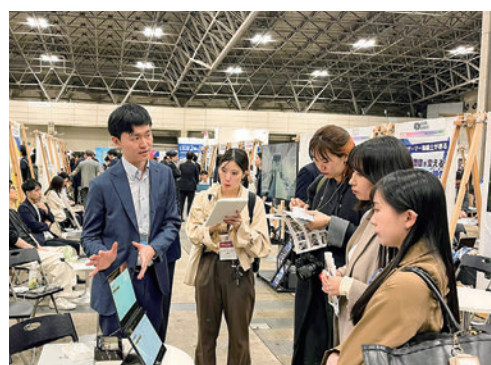
Basic Conceptの特徴、強みに聞き入る来場者

グローバルピッチ コンテスト「Global Fast Track 2026」 参加申し込み