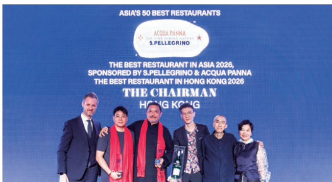
広東料理レストラン「The Chairman」が1位を獲得

香港政府観光局（HKTB）は、昨年香港で開催された「The World's 50 Best Bars 2025（世界のベストバー50）」の授賞式に続き、今年は初めて「Asia's 50 Best Restaurants（アジアのベストレストラン50）」の授賞式を香港に招致しました。