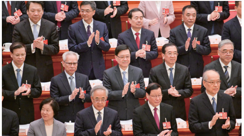
3月5日、北京で開催された第14期全国人民代表大会第4回会議の開会式に、李行政長官(前2列目中央)が出席

李家超(ジョン・リー)行政長官は、「第15次五カ年計画は、今後5年間の国家の社会・経済発展に向けた青写真かつ行動指針。質の高い発展での顕著な成果や科学技術の”自立自強”、生活の質のさらなる向上が含まれている」との認識を表明。香港政府として「計画綱要との連携を積極的に進め、香港の強みを生かして貢献する」と語りました。