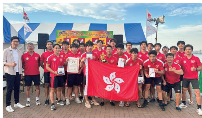
「香港カップ」優勝の中国香港龍舟總會が記念写真。謝智浩（レオ・ツェー）次席代表（左端）も共に

表彰式では、香港経済貿易代表部の謝智浩（レオ・ツェー）次席代表が登壇し、参加した全ての選手の健闘を称えとともに、素晴らしいレースとスポーツマンシップに感謝の意を表しました。