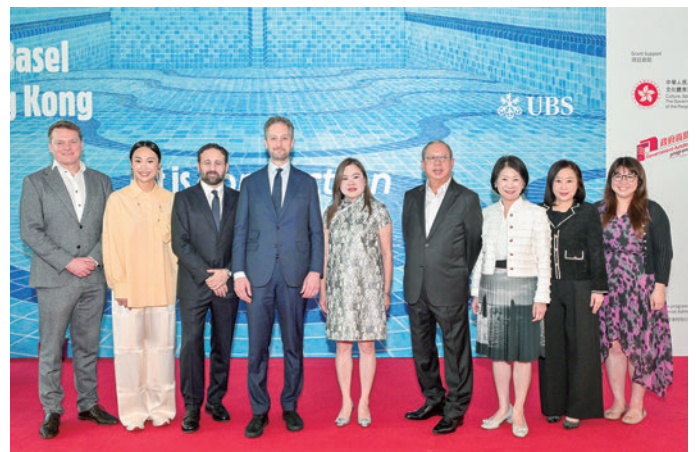
香港コンベンション&エキシビションセンターで、「アート・バーゼル香港2026」のオープニングレセプションを開催(3月25日)

一方、3月29日に閉幕した第11回「アート・セントラル」も、国内外から4万人以上の来場者を集めました。香港、アジア、そして世界各国から117のギャラリーと500人以上のアーティストが参加し、2015年の開始以来最大規模のアート・セントラルとなりました。