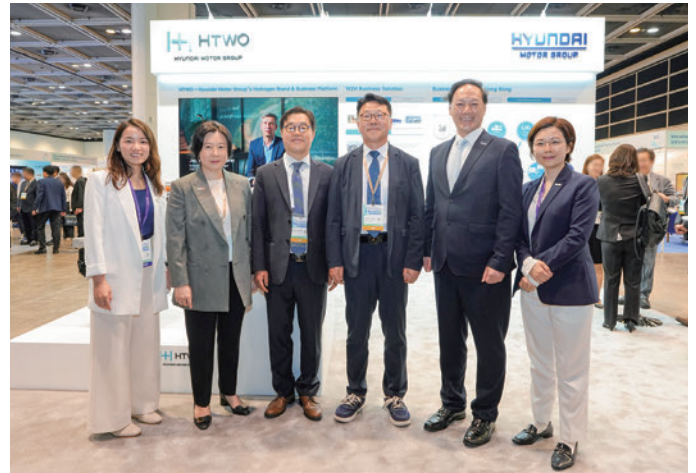
同シンポジウムに参加した現代自動車や香港投資推進局（インベスト香港）の幹部ら

協力の重点分野は、埋立地ガスをクリーンエネルギーへ転換する廃棄物由来水素技術の開発。液化水素燃料補給インフラの実証事業を早期に開始することも挙げています。観光バスや空港シャトルバスなどの用途に応じて設計された水素燃料電池商用車の導入も目指しています。