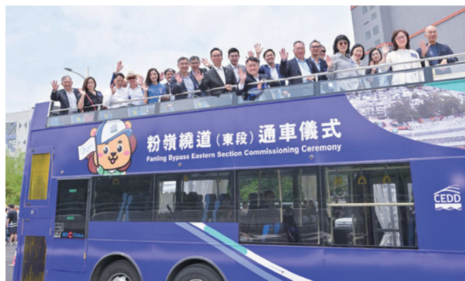
来賓らがオープンバスで同バイパスを走る

同区間は、全長約4キロメートルの2車線道路で、地上道路、地下道、高架橋で構成されています。