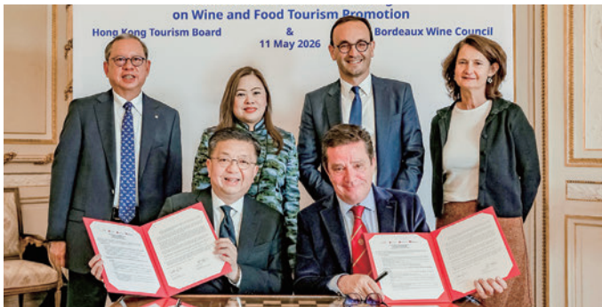
HKTBとボルドーワイン委員会の「ワイン・グルメ観光促進に関する覚書」の調印式(5月11日)

文化・スポーツ・観光省と香港政府観光局(HKTB)の高官らがフランスのボルドーを訪問し、ワイン・グルメ観光促進の協力強化に向けて、HKTBとボルドーワイン業界団体「ボルドーワイン委員会」(CIVB)の間で覚書を締結しました。