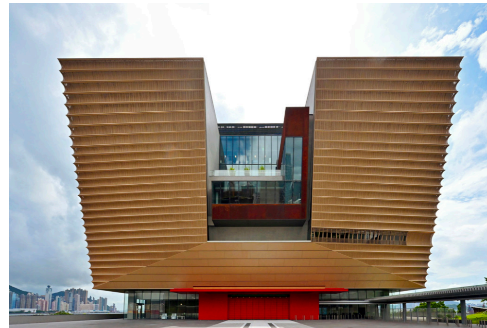
홍콩고궁박물관의 외관은 건축가가 자금성에서 영감을 받아 중국 전통 예술과 조화를 이뤘다.

홍콩의 대규모 문화예술 지구인 서구룡 문화지구(The West Kowloon Cultural District)에 홍콩고궁박물관이 지난 7월 3일 개관하였다. 홍콩고궁박물관은 9개의 전시실을 보유하고 있으며, 베이징의 고궁박물관으로부터 대여받은 국보로 인정된 국가 1급 문화재를 포함하여 900여 점의 보물을 전시하고 있다. 이 중 대부분은 홍콩에서 최초로 전시되는 것들이며 외부에 한 번도 공개되지 않은 보물도 있다. 향후 본 박물관에서는 정기적으로 중국 문화예술과 관련된 특별 전시회 및 세계 각국의 진귀한 문화 예술품을 선보일 계획이다.