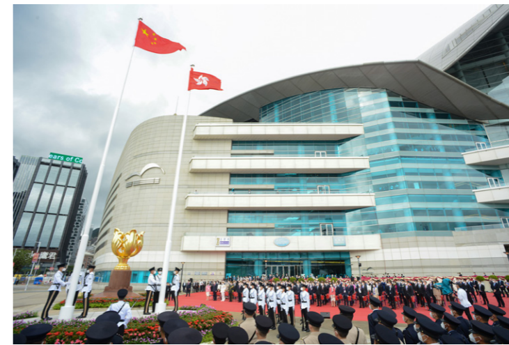
지난 7월 1일 열린 홍콩특별행정구 설립 25주년 기념 국기 게양식

제6기 홍콩특별행정구 정부 출범 행사가 지난 7월 1일 홍콩컨벤션전시센터에서 열렸다. 시진핑 국가주석은 홍콩을 방문하여 존 리 신임 홍콩 행정수반과 주요 관리의 취임 선서를 받았다.