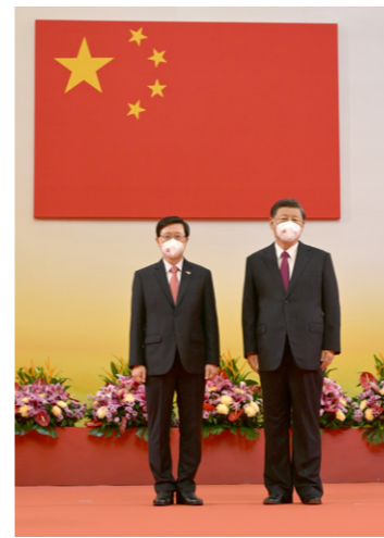
시진핑 국가주석(사진 오른쪽)과 존 리 신임 홍콩 행정수반(사진 왼쪽)