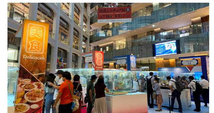
지난 7월 28일부터 8월 7일까지 도쿄에서 열린 전시회는 약 30,000명의 관람객이 다녀갔다.

홍콩 미니어처 전시회는 한국에서 처음 개최되는 전시회이며 과거 중국 본토, 홍콩, 호주, 일본 및 싱가포르 등지에서 성황리에 개최된 바 있다. 이번 전시회는 홍콩의 소중한 전통과 독특한 문화, 도시 경관 및 일상생활을 보여주는 홍콩 예술가들이 만든 40여 점의 미니어처 작품을 선보일 예정이다. 관람객들은 미니어처 작품을 통해 홍콩의 점진