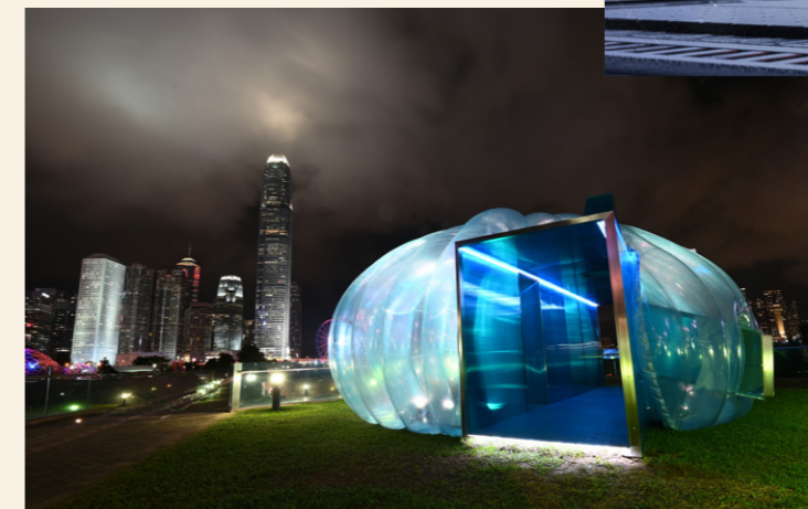
육지와 바다의 연결성을 보여 주는 작품인 《Water Capsule Submarine》