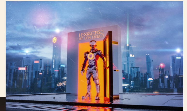
작품 《Symphony of the Future》는 증강현실(AR) 기술을 활용하여 음악, 음향 및 조각의 다양한 예술의 형태를 경험하여 예술적이고 미래적인 창작물을 수용하도록 했다.

자세한 내용은 다음 링크를 참고 - https://artatharbour.hk