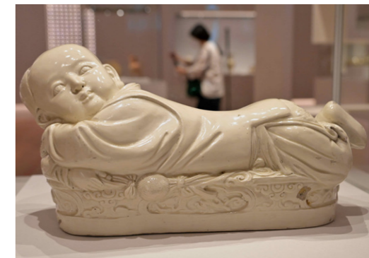
홍콩고궁박물관의 다른 전시품