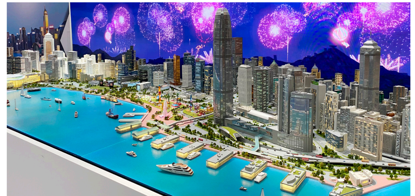
한국에서 처음 선보이는 미니어처 작품 중 하나인 <빅토리아 하버> (축적 1:750)

홍콩특별행정구(HKSAR) 설립 25주년을 기념하고자 아래와 같이 다양한 이벤트가 한국에서 개최될 예정이다.