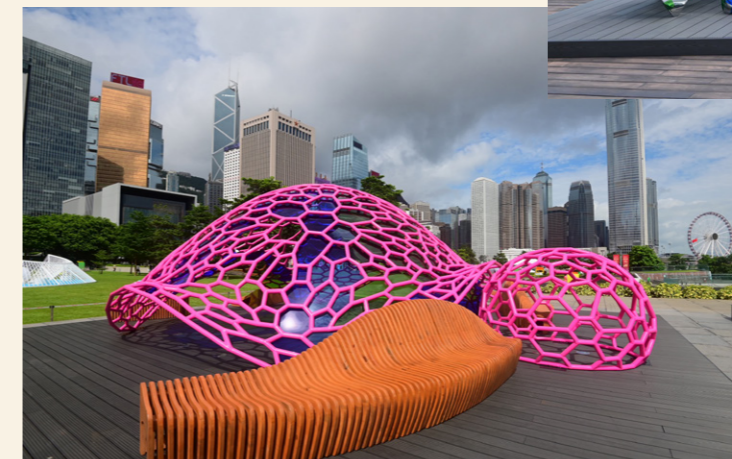
거북이 등껍질에서 영감을 받은 수학 조각 작품 《Loving Home》

HK 미래를 예측하는 가장 좋은 방법은 미래를 창조하는 것. 홍콩, 기회의 세계