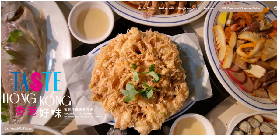
홍콩관광청 ‘Taste Hong Kong’ 웹사이트

홍콩관광청에서는 중화요리학원(Chinese Culinary Institute)과 협력해 새롭게 제작한 미식 가이드 ‘Taste Hong Kong’을 발표하였다. 홍콩의 풍부한 미식 문화를 기념하는 이번 가이드는 50명 이상의 마스터 셰프들이 추천한 홍콩 전역 250개 레스토랑을 소개하고 있다.