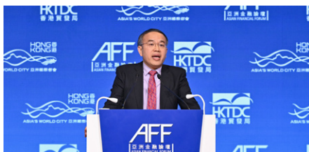
크리스토퍼 후이 홍콩 재무 국고부장관은 1월 26일 상하이금 거래소(Shanghai Gold Exchange)와의 협정 체결식에서 홍콩 금 시장 발전 청사진과 협정의 전략적 의미를 설명

홍콩을 세계적인 금 거래 허브로 육성하기 위한 강력한 의지에 힘입어, 지난 1월 29일 '항셱 골드 ETF(Hang Seng Gold ETF)'가 홍콩거래소