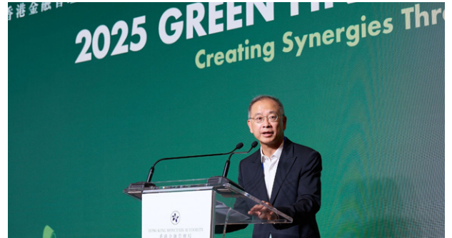
그린 핀테크 심포지엄에서 에디 유 홍콩금융관리국 총재의 개회사

이번 청사진은 생태계 협력, 기술 발전, 인재 및 대외 협력 등 세 가지 핵심 축을 중심으로 다양한 정책 이니셔티브를 제시한다. 홍콩금융관리국은 향후 몇 달 이내에 양자 준비도 지수, 신규 리스크 데이터 전략, 핀테크 사이버보안 기준, 역량 개발 지원 등 네 가지 핵심 프로젝트를 추진할 예정이다.