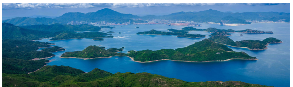
미르스 베이 내 다양한 생태계는 경산호, 해마, 투구게, 흰배수리 등 국가 보호 야생동물의 중요한 서식지로 알려져 있다.

홍콩 북동부 해역에 위치한 미르스 베이(Mirs Bay)가 중국 생태환경부가 발표한 '아름다운 만(Bay)의 우수 사례'에 선정되었다. 이는 홍콩에서 처음으로 국가 차원의 인정을 받은 사례다. 이는 홍콩특별행정구 정부의 해양 생태환경 보호 노력과 함께 광둥-홍콩-마카오 대만구를 세계적 수준의 아름다운 만 지역으로 발전시키기 위한 협력 성과를 보여주는 것으로 평가된다.