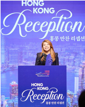
홍콩 만찬 리셉션에서 원섬 아우 수석 대표 환영사