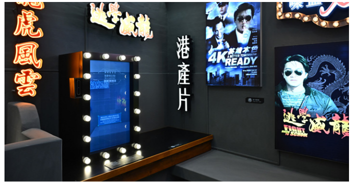
‘야우마테이 경찰서’ 전시 내 포토 부스