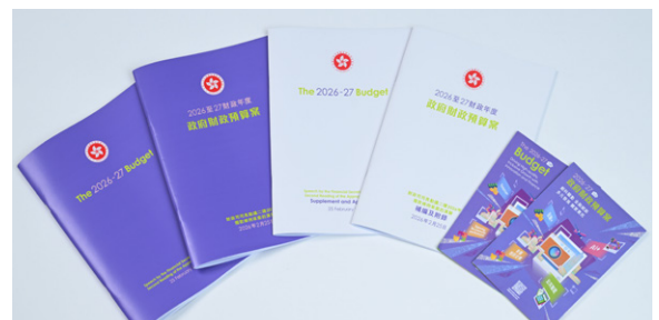
예산안 소책자(영문 및 중문)

폴 찬 재정사장(좌측에서 두 번째)은 2월 25일 중앙정부청사에서 2026-27년도 예산안 관련 기자회견을 진행함. 이날 기자회견에는 크리스토퍼 후이 홍콩 재무 국부장관(우측에서 두 번째), 앤드류 라이 재경사무국고급 상임비서장(좌측에서 첫 번째), 이리나 판 정부 수석 이코노미스트(우측에서 첫 번째)도 참석