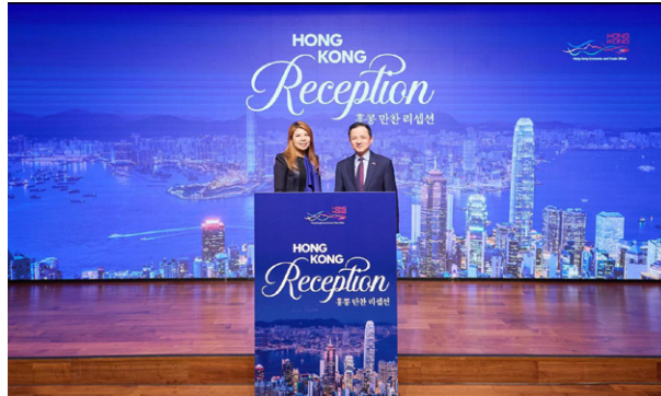
다이빙(戴兵) 주한 중국대사(우측)와 원섬 아우 수석대표(좌측)

홍콩경제무역대표부는 홍콩의 최근 발전현황에 대한 업데이트를 제공하고 홍콩-한국간 민간 및 경제 분야의 교류를 강화하고자, 2월 12일(목) 서울에서 리셉션을 개최하였다. 국내 정·재계·학계·언론계·문화예술계에서 150여명 인사들이 참석하였다.