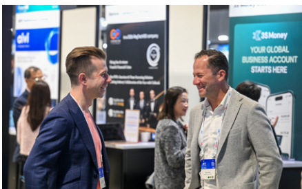
제19회 아시아 금융 포럼(AFF)

‘변화하는 환경 속 새로운 지평을 공동 창출 (Co-creating New Horizons Amid an Evolving Landscape)’을 주제로 1월 26일부터 열린 제 19회 아시아 금융 포럼(AFF)에서는 전 세계에서 150명 이상의 주요 연사들이 참석해 금융시장의 최신 동향을 논의하고, 변화의 시대 속에서 상호 이익을 위한 경제 간 협력 방안을 모색했다. 존 리 행정수반은 홍콩이 국제 금융 허브로서