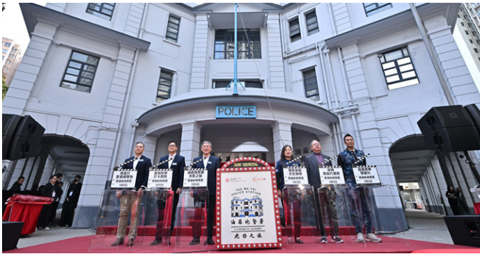
‘야우마테이 경찰서’ 전시 개막식

유산과 범죄 영화 클래식이 그려낸 시대적 배경을 몰입감 있게 체험할 수 있는 기회를 제공하고 있다.