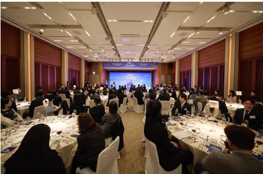
국내 정·재계·학계·언론계·문화예술계에서 150여명 인사들이 참석

아우 수석대표는 '일국양제' 하의 홍콩의 독특한 위상을 강조하며, 홍콩이 중국 본토와 한국, 그리고 더 넓은 지역을 연결하는 '슈퍼 커넥터'이자 '고부가가치 창출자'로서 역할을 계속 수행해 나갈 것이라고 설명했다. 아울러, 2025년 정책연설에서 도입된 Economic and Trade Express(ETE) 플랫폼을 소개하며, 이 플랫폼이 한국을 포함한 해외 비즈니스 사절단 파견 등을 통해 홍콩의 중소기업과 스타트업의 해외 진출을 지원하는 동시에 더 많은 기업이 홍콩에 투자하고 사업을 설립하도록 촉진해 기업과 투자의 양방향 흐름을 확대하는 데 중점을 두고 있다고 강조했다.